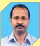
Pareekutty K K Oil Movements & Storage