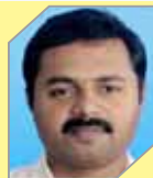
Rafeeqe N M Projects - Propylene Derivatives Petchem