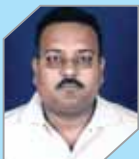
Das K K Tech - Process Engineering