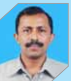
Prabhakaran M Manufacturing - Refinery II