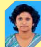
Shiny Sara Varghese Manufacturing - Refinery I