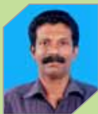
Shaji A T Oil Movements & Storage