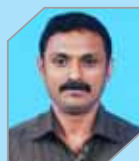
Clement K A Manufacturing - Refinery I