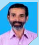
Ramakrishnan K G Manufacturing - Refinery I