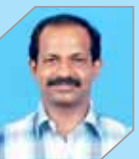
Sabu JO Manufacturing - Refinery II