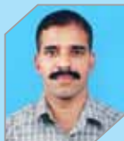
Sijo V T Manufacturing - Refinery II