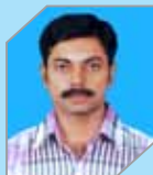
Syammanohar N Manufacturing - Refinery II