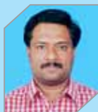
Noble Thomas Manufacturing - Refinery II