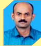
Sunil C K Oil Movements & Storage