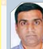
Sangoi Chetan K Projects-Motor Spirit Block Project