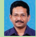
Cauma Paul Mfg