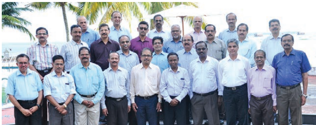
The participants with the faculties

A three day workshop on 'Visionary Leadership Planning' was conducted for Management Committee Members (MCM) during 25 – 27 September. Twenty five MC Members including Executive Director I/C (KR) and General Managers actively participated in the programme.