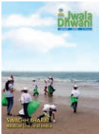
Cover : Swachh Bharat Abhiyan in progress at Mumbai's Juhu Beach

Such real life experiences are invaluable. This issue of JwalaDhwani celebrates the one year of observance of Swachh Bharat Abhiyan at BPCL Kochi Refinery. On the occasion of Gandhi Jayanthi in the 100th anniversary year of Mahatma's return to India, JwalaDhwani urges one and all to continue supporting this inspiring mission for a clean India.