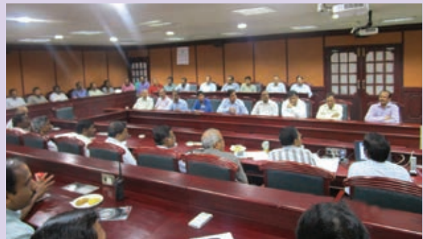
The opening meeting session of the Internal Safety Audit team with KR executives. The audit was held from 7-11 Sept 2015 by a group of multi disciplinary group including members from group Refineries