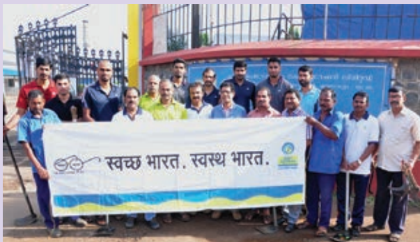
Employees who took part in the Swachh Bharat initiative conducted on 12 September

A five day workshop was conducted with Mr P S Joshi , an eminent faculty specialized in conducting training in pressure vessels, piping and ASME/API standards from M/s.Asian Academy of Professional Training. Engineers from Maintenance, Inspection, E&C and P&U attended the training programme.