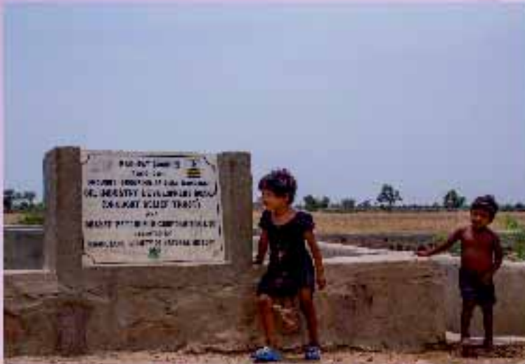
Fostering a Bond through Boond