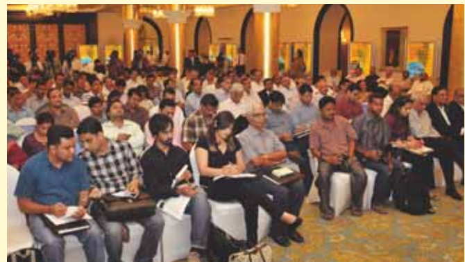
The media pay rapt attention at the Media Meet.

Shareholders expressed their delight with the generous issue of Bonus shares at the 59th AGM of the Corporation that was held on 21st September 2012 at K.C. College, Mumbai. Bonus shares have been allotted in the ratio of one fully paid bonus equity share of ₹ 10 each for every equity share of ₹ 10 held. The venue bore a festive look and everyone revelled in the red carpet treatment provided, right from the bright panels showcasing our activities in various spheres to the single long-stemmed rose presented at the entrance. The Ordinary Business of adoption of Audited Accounts for the Financial Year 2011-12, Declaration of Dividend, Reappointment of Directors, Fixation of remuneration of Statutory Auditors and Special Business of Appointment of Directors were duly transacted.