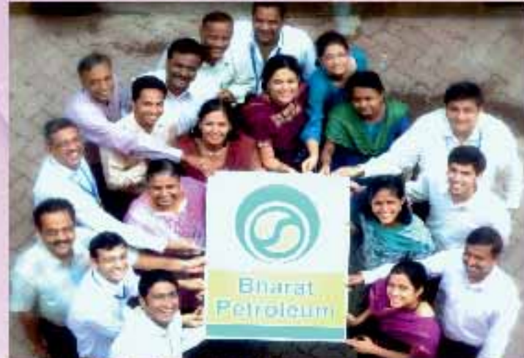
BPCL-Together Each Achieves More