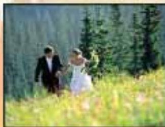
7. To Love

The room was so quiet you could have heard a pin drop.