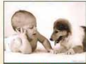
3. To Touch