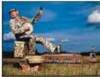
2. To Hear