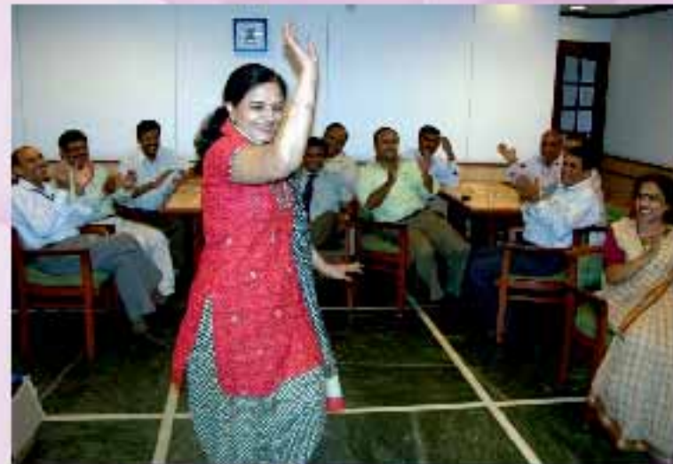
Enjoyable Place to Work