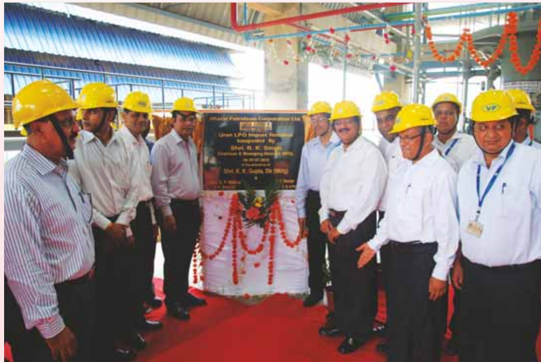
C& MD inaugurates the Cryogenic LPG Import Terminal at Uran.

Refrigerated LPG Storage: Two tanks, each of 8000 MT capacity double wall double integrity cup in tank, are installed over a concrete deck slab propped up on 256 columns strutting from a pile cap with pile foundation. The design is reminiscent of an insulated flask which retains the temperature of its contents, only on a giant scale! The tanks are insulated at the bottom, shell and over the suspended roof. The cup in tank holds the liquid LPG at cryogenic temperature. The outer tank has been designed for full containment of vapours and liquid in the event of failure of the inner tank. Mr. Suman Kumar remarked, " Each stage of construction of cryogenic tanks including fabrication, piping etc. brought forward new issues and dealing with them