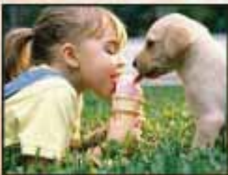
4. To Taste