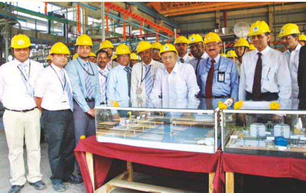
Mr. Jaipal Reddy, then Union Minister for Petroleum & Natural Gas visits the LPG Import facility at Uran.