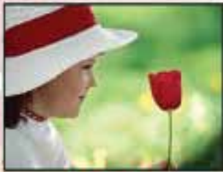
1. To See

The girl hesitated, then read, "I think the 'Seven Wonders of the World' are: