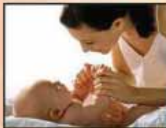
5. To Feel