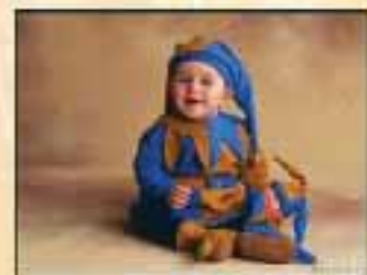
6. To Laugh